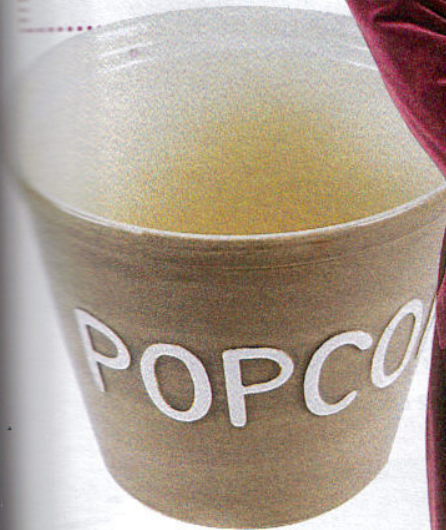
Sofakos med popcornbolle. Fra Hilmers Hus, kr 198,-